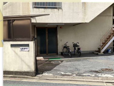
通用口のインターホンを押してください